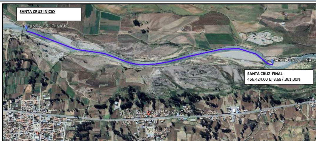
Foto 1.- Se observa el punto de inicio en el sector Santa Cruz-distrito de Leonor Ordoñez